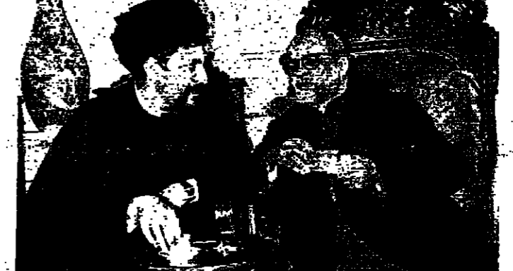
البطيريك خريش والامام الصديق امس